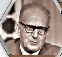
ግሊክ ቢን ንቢ